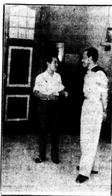
Bung Tomo (kiri) sedang bertjap2 dengan Sri Sultan.

(Kawat eksklusif) Berhubung dengan penglepasan tawanan politik, yang sebagaimana dikabarkan beberapa hari yang lalu belum lagi sampai di Jogja, maka djuruwarta "Waspada" di Jogja mengawatkan hari ini bahwa tiga belas orang diantara mereka telah tiba pada malam Chamis di Jogja dari Ambarawa.