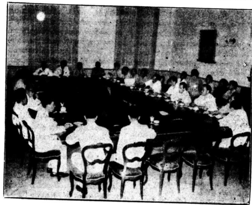
Gambar ini ialah pertemuan kabinet jang pertama sesudah pemerintah Republik kembali di Jogja. jang dihadiri djuga oleh Ketua Badan Pekerja, Wakil Angkatan Perang, Kepolisin dan Dewan Pertimbangan Agung.

Tetapi disamping itu kita melihat arti lain jaitu bahwa dengan perkataan itu Hatta memperingatkan orang2 yang hendak merubah kan Republik dari dim (ingat pe